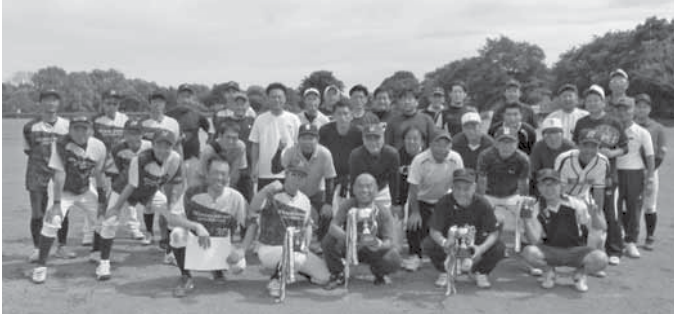
上位4チームの皆さん