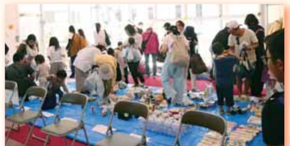
▲SDGsでエコ生活(フードドライブ)