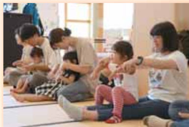
▲親子リズムあそび教室