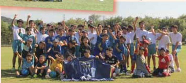
▲明治安田presentsガスパ群馬サッカー教室