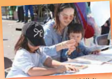
▲マイバックにお絵描き