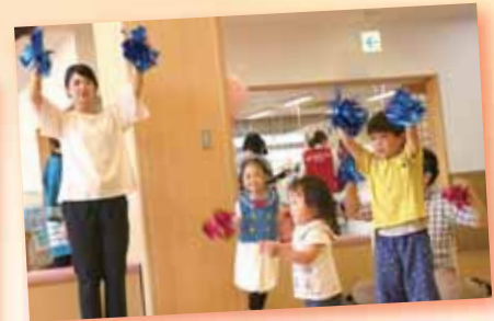
▲親子リズムダンス教室