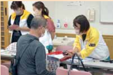
▲よしおか健康まつり