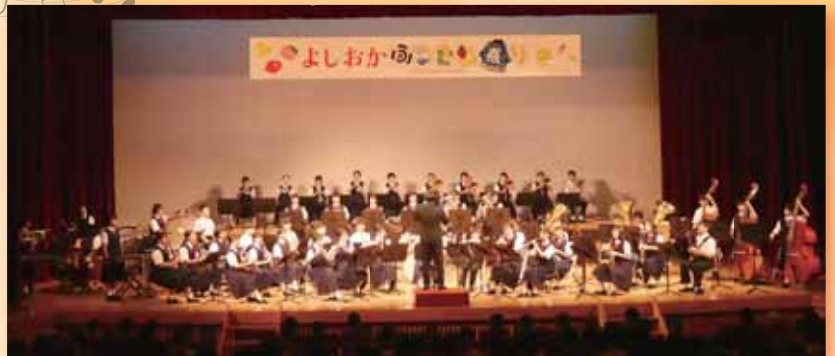
▲吉岡中学校吹奏楽部演奏会