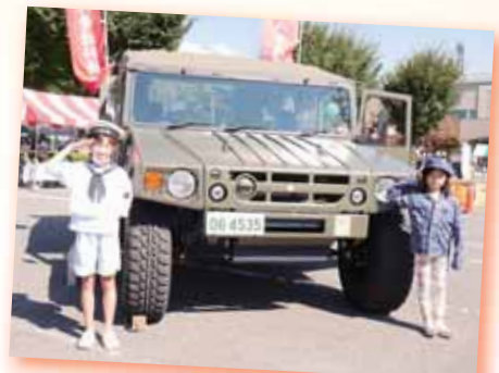
▲ ミニ迷彩服写真撮影