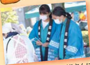
▲ 吉中ボランティアの皆さんに手伝っていただきました