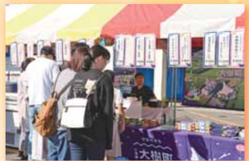
▲ 友好都市北海道大樹町物産品販売