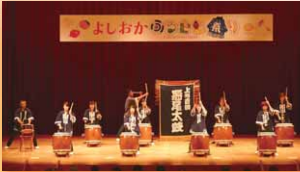
▲ 上州吉岡船尾太鼓の演奏で幕開け

10月13日@によしおかふるさと祭りが開催され、多くの人で賑わいました。役場北駐車場、文化センター、ふれあい公園（文化センター東側）、保健センター、緑地運動公園サッカー場、老人福祉センターを会場に、物産品の販売や模擬店、各種イベントなどが開催されました。大盛況のお祭りの様子を写真でお伝えします。