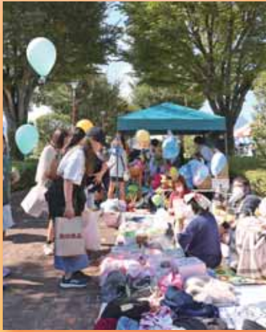
▲フリーマーケット