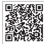
▲群馬県デジタル窓口

初回接種が完了していない人や、乳幼児(6カ月から4歳まで)、小児(満5歳から11歳まで)の予約も受け付けています。お気軽にお問い合わせください