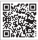
▲特設サイトはこちら

国税庁ホームページに定額減税制度についての各種情報を掲載している「定額減税特設サイト」が開設されています。説明会で使用するDVDと同じ内容の動画を配信しています。ぜひご活用ください。