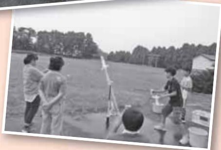
※令和5年度 事業の様子