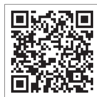
▲町ホームページはこちら