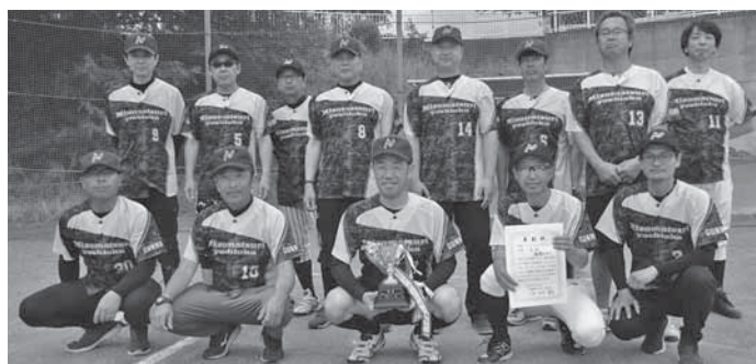
優勝 溝祭自治会(写真) 準優勝 陣場自治会 第3位 駒寄自治会