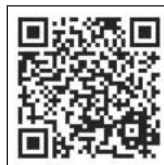
▲新型コロナウイルス定期予防接種 についてはこちら