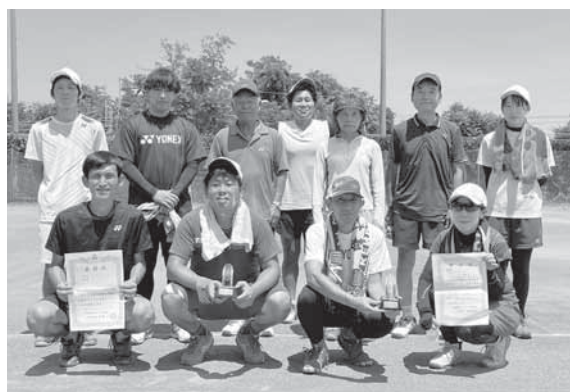
優勝・準優勝・第3位の皆さん