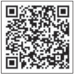
▲国税庁LINE 公式アカウント

高崎税務署職員などの申告 相談を希望される人は、2月17 日①～3月17日②の間、ビエ ント高崎へお越しください。なお、 ご来場の際には、国税庁LINE E公式アカウントから、入場整 理券を事前に取得いただくこと も、マイナンバーカードをお 持ちください。