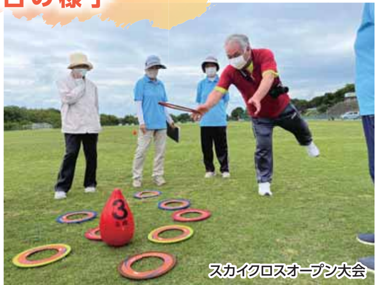
スカイクロスオープン大会