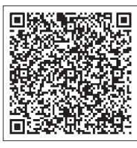
▲ぐんま電子申請受付システムはこちら