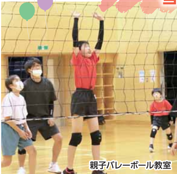
親子バレーボール教室