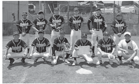
優勝 川西レパーズ(写真) 準優勝 楽戦