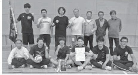
優勝 漆原東自治会(写真) 準優勝 上野田自治会 第3位 下野田自治会、漆原西自治会