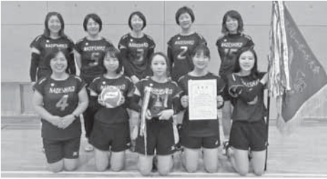
優勝 漆原西自治会(写真) 準優勝 北下自治会 第3位 大久保寺上自治会、上野田自治会