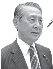
飯塚 憲治 議員

窓口業務は多角化を極め、住民の声に積極的に対応し、たらい回しを防止するためにも統合は必要。また職員の連携により、行政サービスの改善向上を期待する。