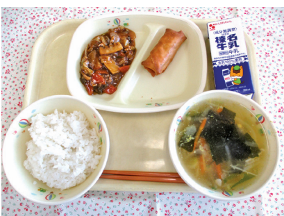
学校給食で地産地消を

答 農家への補助制度の整備や、給食による地産地消のメリットを広く周知し、農業関係者や生徒・保護者の理解を求めるなどの方法を研究していきたい。