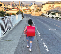
小学校入学をスムーズに

答 収集回数を増やすに当たり、経費面現在の収集スケジュールを大幅に見直す必要があり、本年度中には回数を増やすことは難しく、早くても来年度以降と考えている。