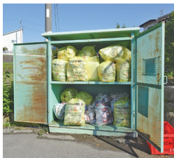
プラスチックの ごみはかさばる