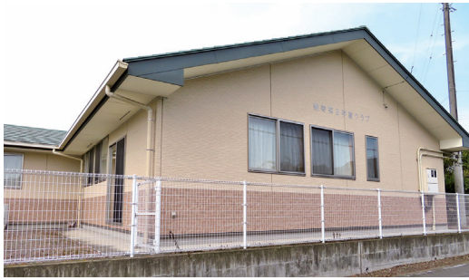
増築され40人定員増となる駒寄第3学童クラブ

問 保育園・認定こども園は入園を希望する人にとって厳しい状況だが、待機児童対策は。