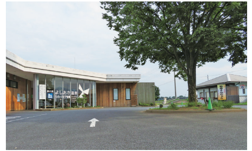
入浴しやすい料金体系に（リバートピア吉岡）

答 多年にわたり社会に尽力してきた高齢者の長寿を祝福し、広く町民の高齢者福祉に対する理解と敬老精神の高揚を促すため