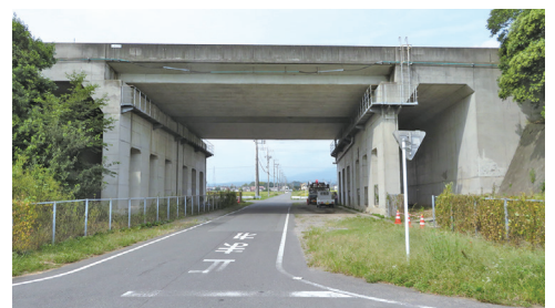
県道大久保上野田線の建設を待つ (関越自動車道のボックスカルバート)

答 現状は、「着手に向けて検討する事業」だが、事業化はされていない。考えられる理由は県内他路線との優先度の違い。以前より渋川市と連携した要望活動において、県の県土整備部長および渋川土木事務所長に着手を強く要望している。