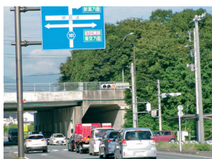
早期設置に期待 (駒寄スマートIC南交差点)

答 「考えて行動できる人」の育成に力を注いでいる。また海・川には大人と一緒に出掛けるよう指導。