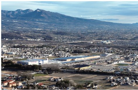
商業進出で税収が増えた（インター東側）

問 令和5年度決算結果を受け、町長の町の財政状況についての所感と「将来に責任のある行政」についての考えは。