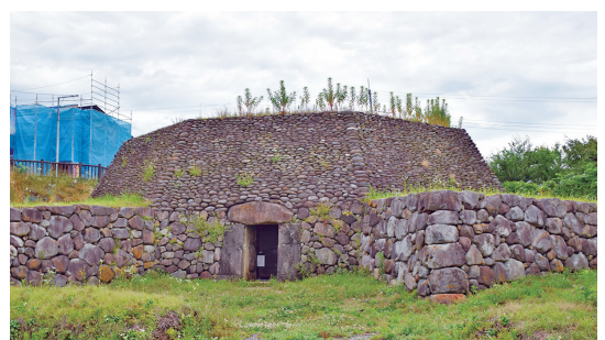
国指定史跡になることに期待（三津屋古墳）

答 三津屋古墳は、国指定相当の埋蔵文化財リストに掲載され、文化庁のホームページで周知されている。