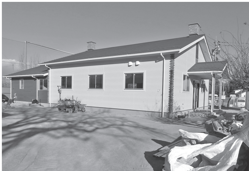
入所条件の緩和が望まれる (建設中の認定こども園駒寄幼稚園学童クラブ)

答 健康子育て課長 園児居残り防止は、運転手と保育士により、乗降車の都度、園児の名簿(チエックリスト)を使用して確認してい