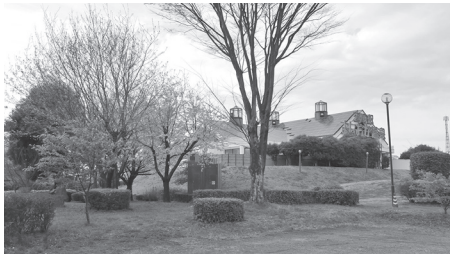
天神東公園にホテル誘致を

問 天神東公園の設備、道の駅・振興公社の状況を聞いた上で、提案がある。集客力、売上高向上のために天神東公園にホテルを誘致しないかという提案である。道の駅プロジェクトという計画で、道の駅の一部または隣接する場所にホテルを建設し、地方の観光産業資源の開発、滞在型観光の需要創出を目指した事業となる。建設はホテル運営会社が行い、土地も、運営会社と町、または個人が賃貸契約を締結することで、特段デメリットが発生するものではない