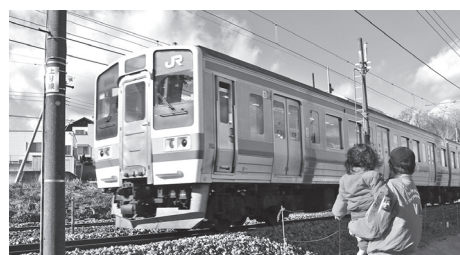
ここから電車に乗りたい

問 吉岡町の価値や魅力を高める新駅は、子どもたちの未来のために必要と思うが、町としての取り組み状況と今後の方向性は。 答 町長 新駅ができた場合の利用者数、設置にかかる巨額の整備費用などの状況を考え合わせ、長期的視野に立った検討・研究を進めていきたいと考えている。 問 児童館の老朽化に伴う整備の予定は。外の遊具が少なく感じるが増設の予定は。 答 町長 修繕工事などを検討したい。遊具の増設は自治会事業などにも利用されて