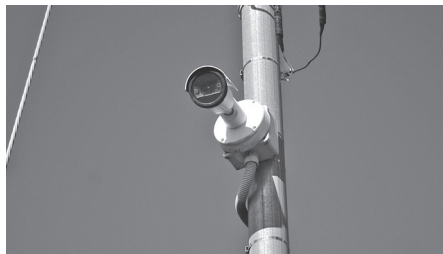
防犯カメラの増設を望む

問 駒寄スマートIC西側の工業誘致エリア土地所有者アンケートを採ったが、その後何もしないのか。 答 産業観光課長 担当部署合同の会議の場を設け、検討し事業工程作成に取り組み。 問 前橋市長はどのようになっているのか。 答 町長 吉岡町のエリアと連携し、事業化を進めていければありがたいと言われている。 問 駒寄スマートIC南の交差点では、右折車両が曲がれず渋滞が起きているが、右折車対策は。