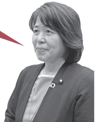
ふじた ゆかり 議員