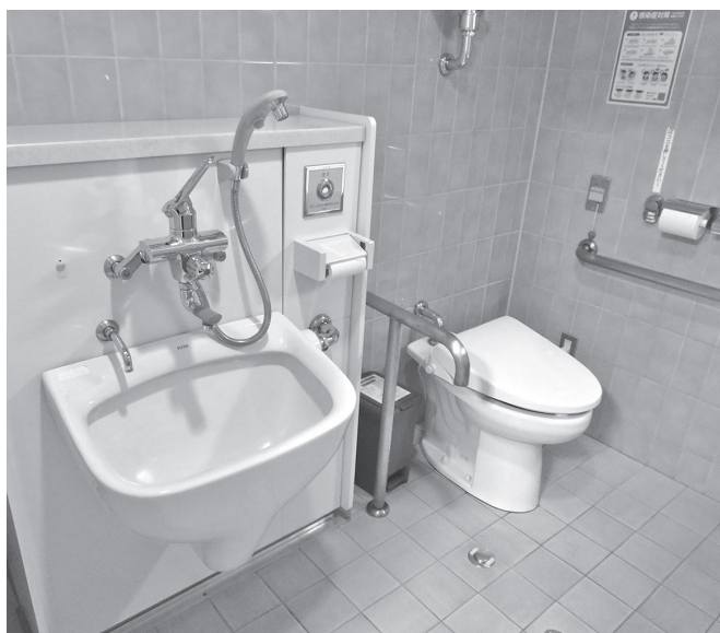
公有施設のトイレの改修を順次進めていく

問 町公有施設のトイレの洋式化はどの程度進んでいるか。災害時の避難場所として指定もしているが、人が避難してきたときの対応は大丈夫か。 答 町長 公有施設のトイレは、従前から洋式化や手すりの設置、※オストメイト対応などの改修を順次進めている。今後も実態に合わせて対応を進めていきたい。 問 北群馬郡は、吉岡町と榛東村の2町村となっている。私は合併推進論者ではないが、今後どのような共同・協力ができるのかといった協議をしてもいいと考える。ふるさと納税や農産物直売所での協力、温泉施設などの共同、観光ルートればさまざまある。両町村で協議の場を持ち協力を進めては。 答 町長 将来的には吉岡町だけでは実現不可能なことや、インパクトの弱い事例もこれから増えることが予想される。そうした意味でも、隣接した榛東村と協力を図ることは、引き続き重要な要素となり得るため、どのような分野で協力することが町民にとって有益かを念頭に検討していければと考える。