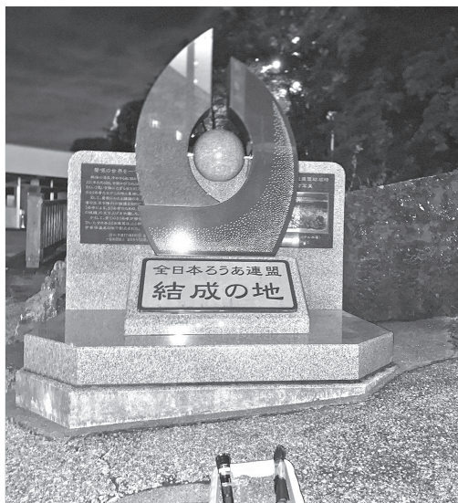
手話言語デーにライトアップされた全日本ろうあ連盟結成の地記念碑（渋川市伊香保）

答 町長 各自治体の手話の関連施策や、関係団体との連携協力などについての見識を広める効果が期待できる。ぜひ参加したい。 問 「全国手話言語市区長会」は、聴覚障害者に対する情報保障の環境整備を進め、全国自治体の施策展開の情報交換を行っている。町村長も準会員として入会できるので、強くお勧めしたいが。