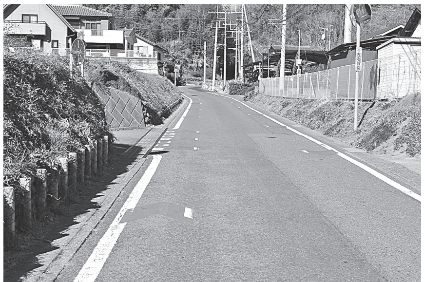
狭道に矢羽設置で子どもを守る