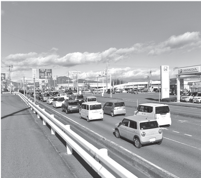
渋滞解消はいつになるのか (大松信号交差点)