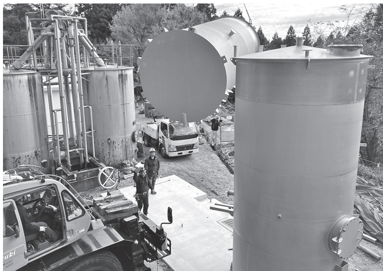
水道施設全体の老朽化は着実に進行している (改修工事が進む上ノ原浄水場)

下水道事業は、一般会計からの繰入金に依存している状況。類似団体と比較した特徴は、企業債残高対事業規模の比率が高いが、