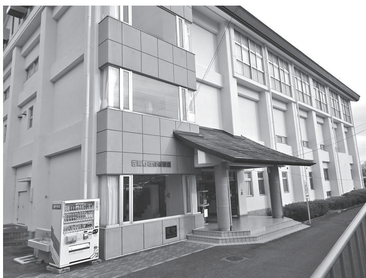
地震発生から数カ月間は、多数の避難生活者がいると想定される(指定避難所である社会体育館)

ア・コンビニ・クリニックなどを地域の住民に開放。また、自治体と協定を結び、災害時に一時避難施設として、住民向けの防災用品を備蓄する例も見られる。町としても、地域経済に好循環をもたらす企業を誘致できるように、あらゆる方向から検討したい。