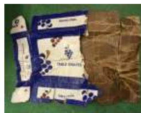
(輸入青果物・水産加工品を入れる段ボール箱)