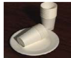
(紙コップ、紙皿、紙製のカップ麺容器など)