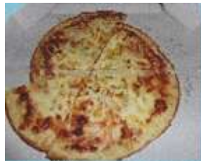
(ピザ、ケーキなどの食品を直接包装した容器)