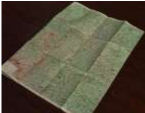
(地図、選挙ポスター)