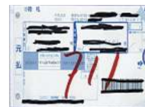
(宅配便の伝票など)