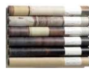
(壁紙、防水シートなど)