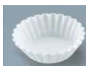
(クッキングシートなど)