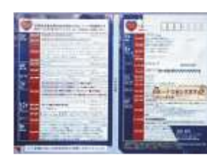
(公共料金の請求書)