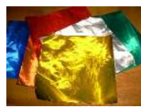
(金銀の折り紙など)