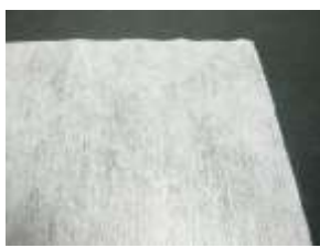
(マスク、簡易お手拭、 包装紙など)