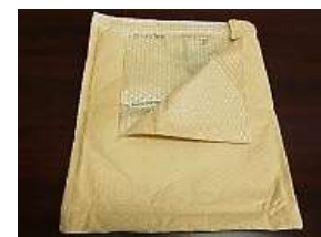
(通販用緩衝封筒など)