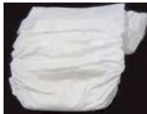
(紙おむつ、生理用品、 ペット用トイレシート)