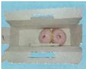
(ピザ、ケーキなどの食品を直接包装した容器)