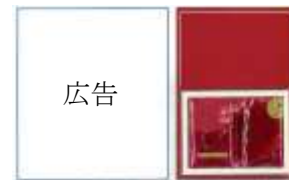
(サンプルが付いたままの 新聞折込チラシ、雑誌)