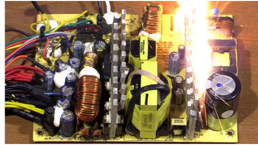
図5 浸水による通電火災のイメージ

(水に濡れた電気製品の内部には、水分が残っていたり、泥や塩分などの異物が付着していたりすることがあるため、通電時に電気回路基板から発火するおそれがある。)