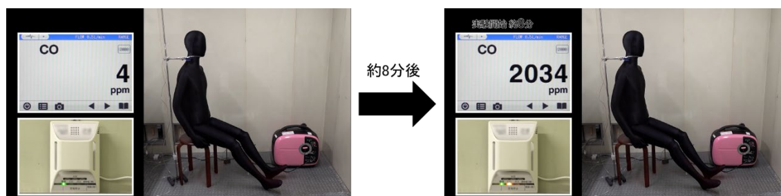
図2 室内で携帯発電機を使用した際の一酸化炭素（CO）濃度の変化